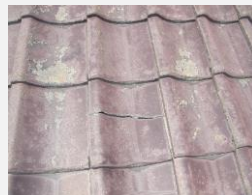
☑ 瓦屋根の劣化・損傷

大切な我が家です。外壁・屋根の状態が不安な方。そろそろ塗替えをお考えの方。 見積り・相談 無料 です。まずは、どうぞお気軽にご相談ください。