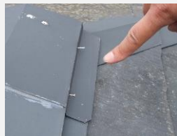
☑ 釘抜け(サビの原因)