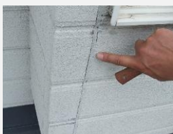
☑ コーキングの割れ