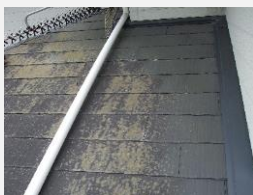
☑ コロニアル屋根のコケ