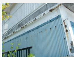
☑ 鉄部や金具のサビ