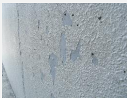
☑ 塗装の剥がれ・膨れ