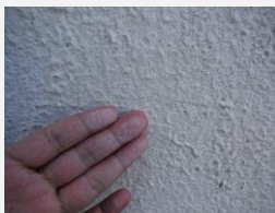
☑ チョーキング(白化)

こうなる前に！！ 早めの補修や塗替塗装をお勧めします ここまで劣化が進むと、塗装だけでは補修しきれない場合があります