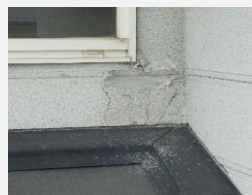
☑ 凍害による壁材の損傷