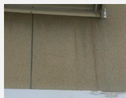
☑ サッシ等からの錆汁